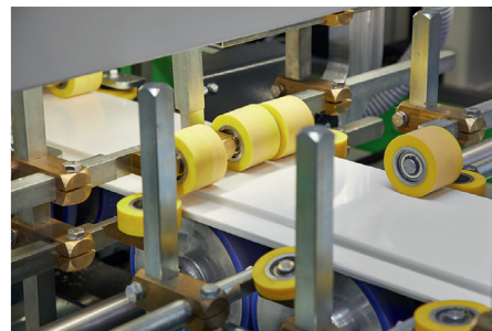
Комплектации станка формируются индивидуально, в соответствии с требованиями каждого клиента.

Начиная от подачи декоративного материала и вплоть до нанесения клея — система автоматической заправки пленки обеспечивает повышенное удобство в эксплуатации.